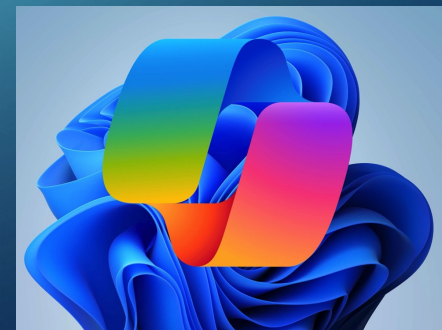
Le logo de Copilot